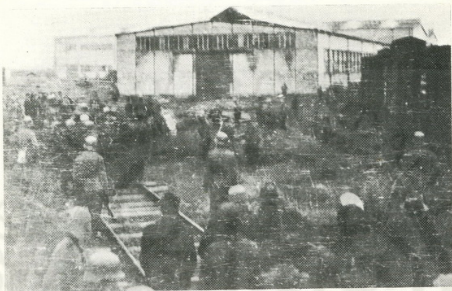
Nemački vojnici zatvaraju u lokomotivsku halu Fabrike vagona pohapšene radnike i građane Kraljeva

gubitaka koje je ovog puta imao, nemački garnizon je uspeo, 15. oktobra ujutro, da odbije napad.