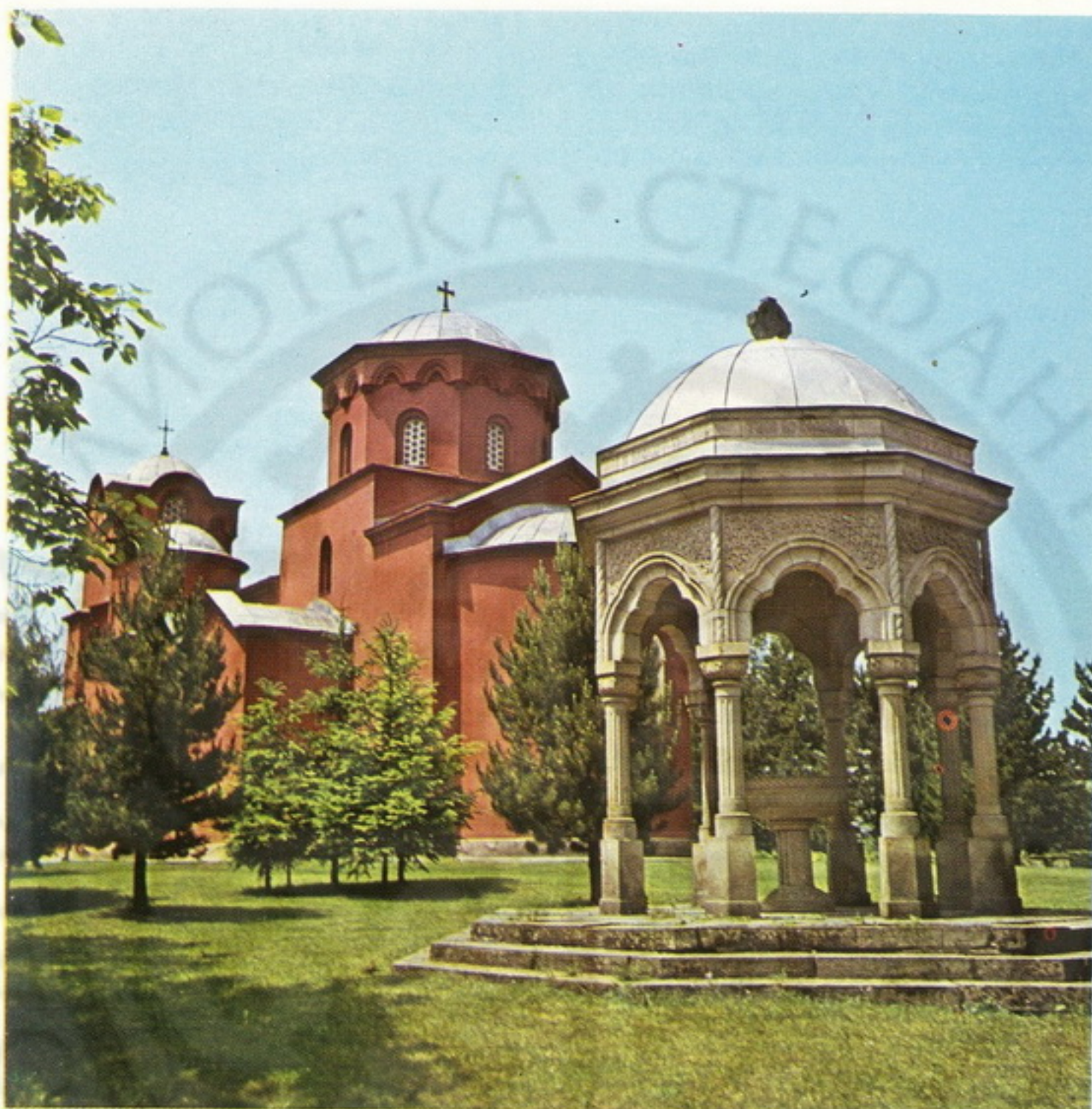
Manastir Žiča (XIII vek)

Planinarski centri su na Goču i Kopaoniku , posebno poznatom po izvanrednim skijaškim terenima.