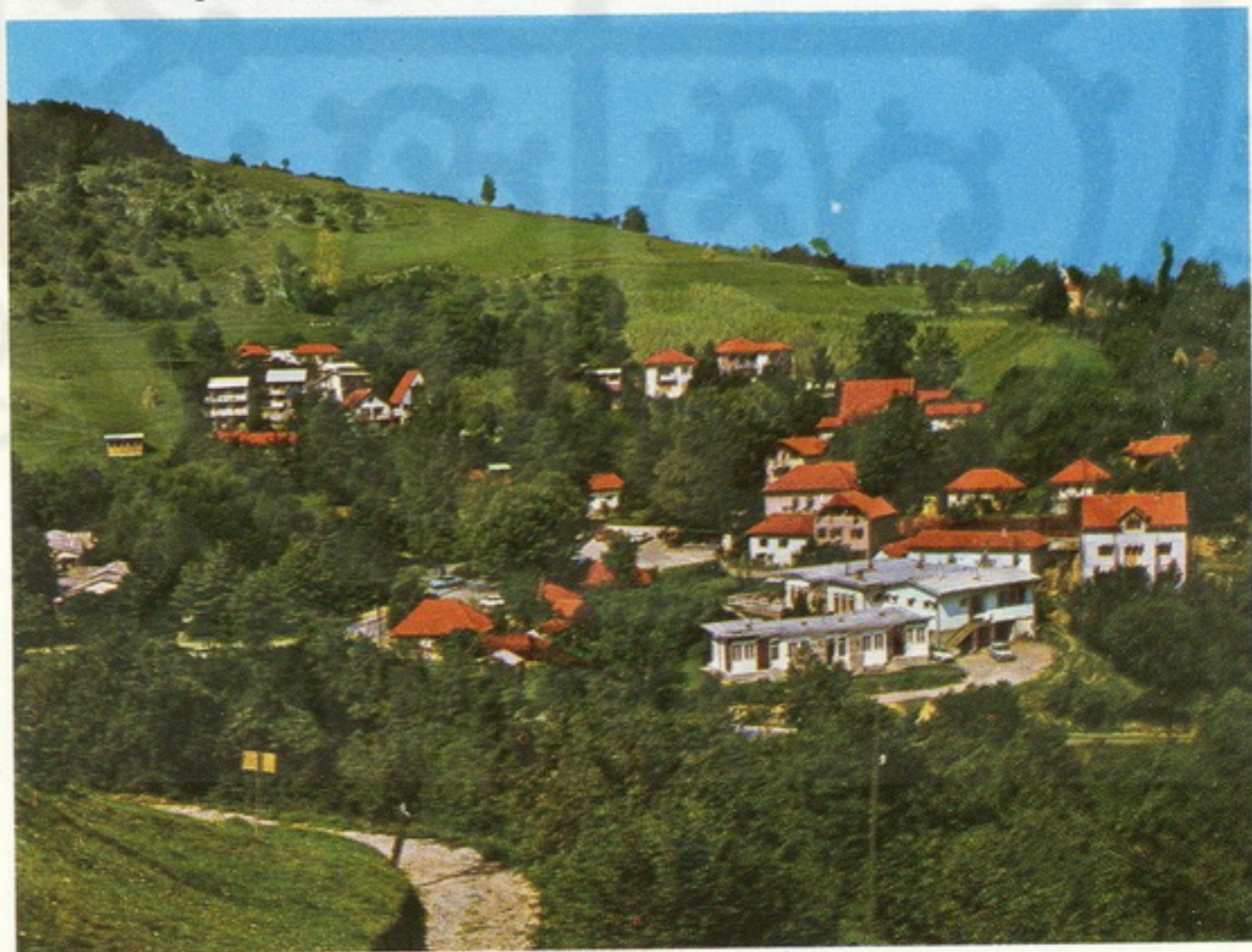
Panorama Bogutovačke Banje

Srednjovekovni grad Maglič (23 km), nalazi se u klisuri Ibra, 200 metara iznad reke. Spominje se na početku XIV veka. Nekada moćna tvrđava — grad sa osam kula danas je konzerviran i jedan je od najočuvanijih srednjovekovnih gradova u Srbiji.