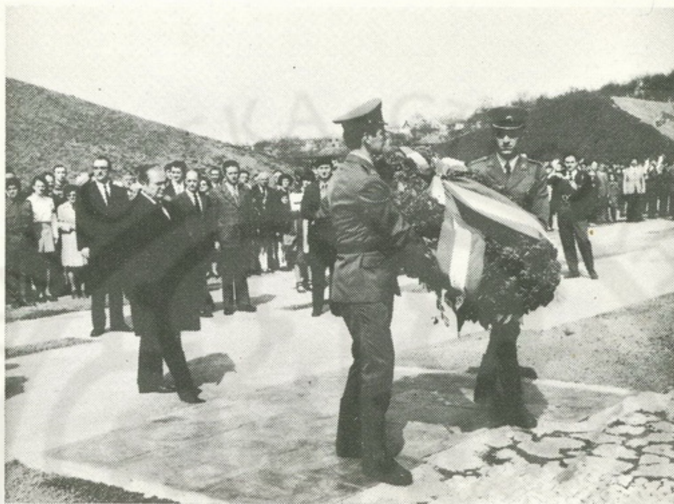
Josip Broz Tito polaže venac na humke palih rodoljuba u Spomen-parku u Kraljevu 1973. godine

K raljevački Spomen — park je VEČITI spomenik b r a t s t v a i j e d i n s t v a — jedne od najznačajnijih ideja socijalističke revolucije naroda i narodnosti Jugoslavije.