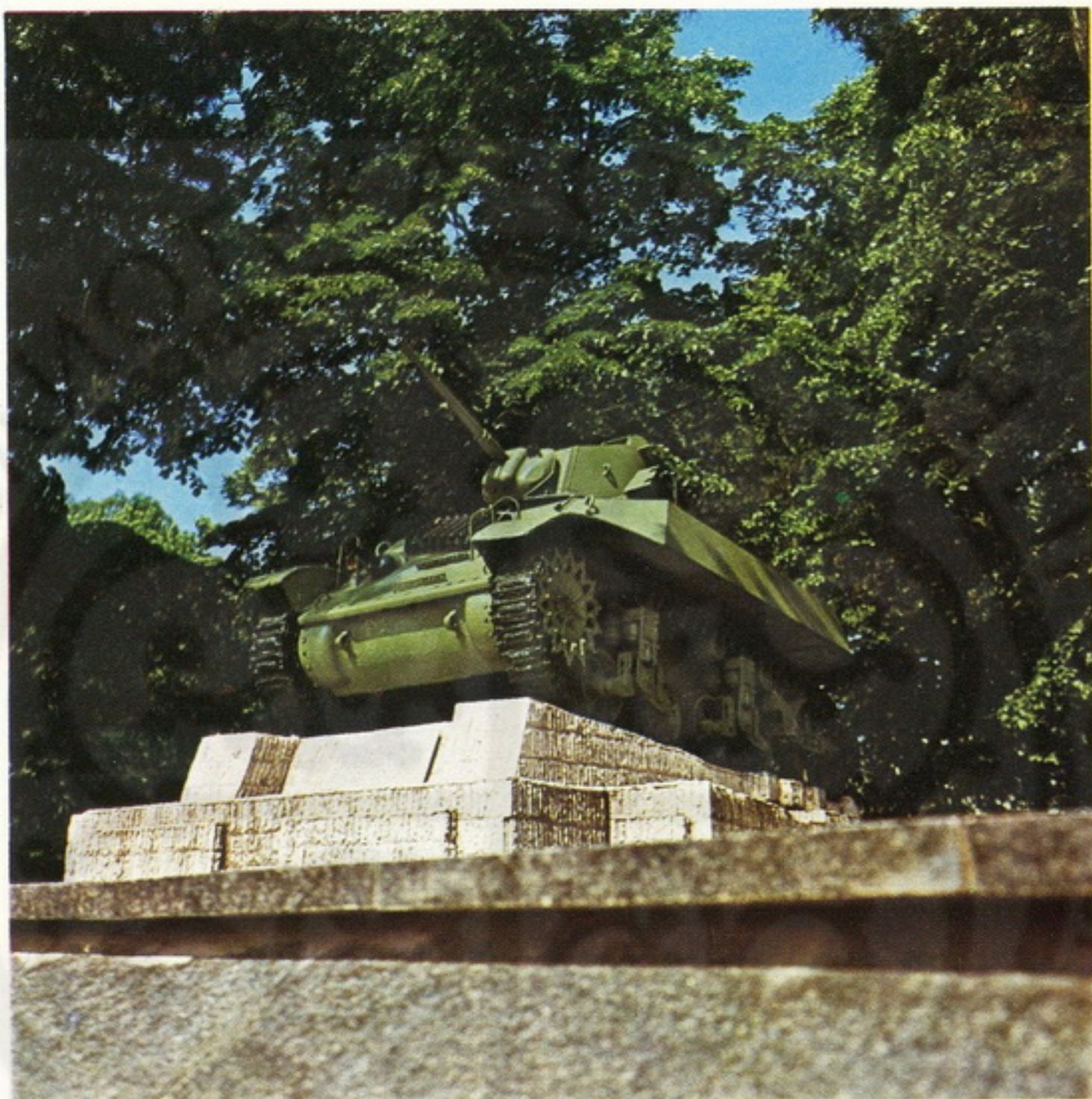
Spomenik prvom partizanskom tenku

dalje razvijati i braniti ideje i tekovine socijalističke revolucije, ostvarene borbom koju su narodi i narodnosti Jugoslavije vodili pod rukovodstvom KPJ i druga Tita.