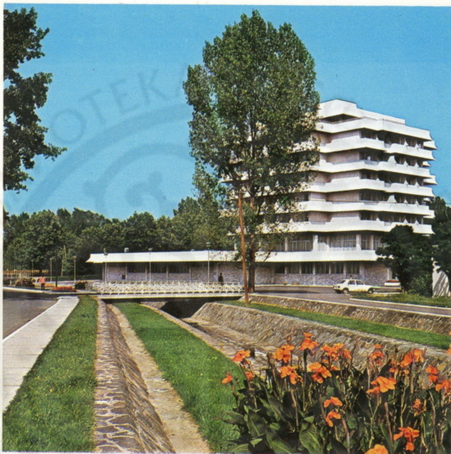
Hotel „Termal“ u Mataruškoj Banji

Mataruška Banja , udaljena 4 kilometra, jedna je od poznatijih banja u Srbiji. Mineralna sumporovita voda temperature 38—40°C, leči reumatična oboljenja zglobova i mišića, išijas, ženske bolesti, kožne i neke druge bolesti. Sezona traje tokom čitave godine. Okolina je živopisna, sa pogodnim terenima za planinarenje i skijanje. Na lbru je moguć ribolov i kupanje.