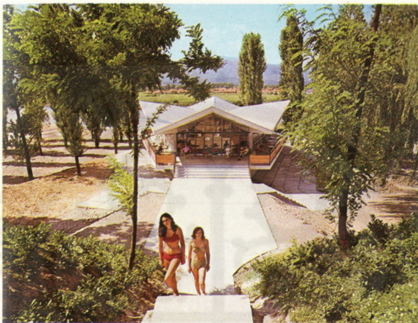
Plaža na Ibru kod Kraljeva — moderan restoran