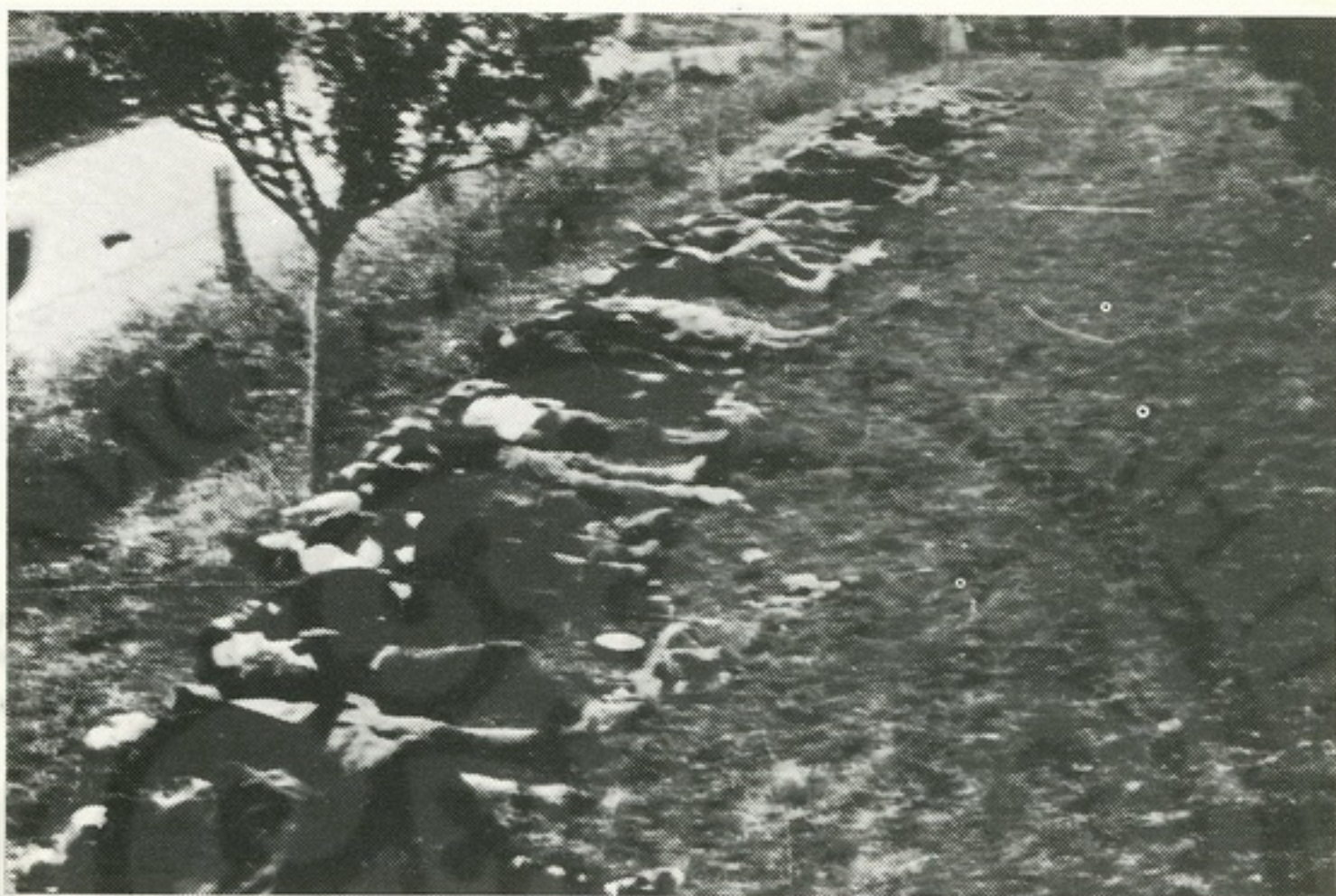
Još jedan masovni fašistički zločin — grupa streljanih građana na ratarskom imanju kod Kraljeva

Pripreme za genocid izvršene su u skladu sa naredbom generala Bemea: „Za celu Srbiju ima se stvoriti zastrašujući primer, koji mora najteže pogoditi celokupno stanovništvo“.