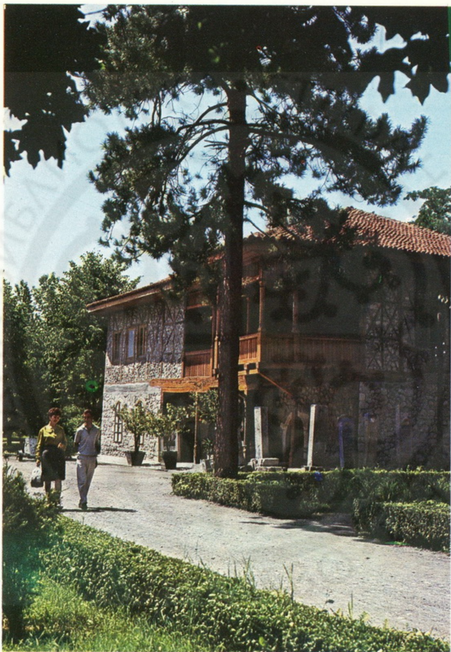
Zgrada Narodnog muzeja