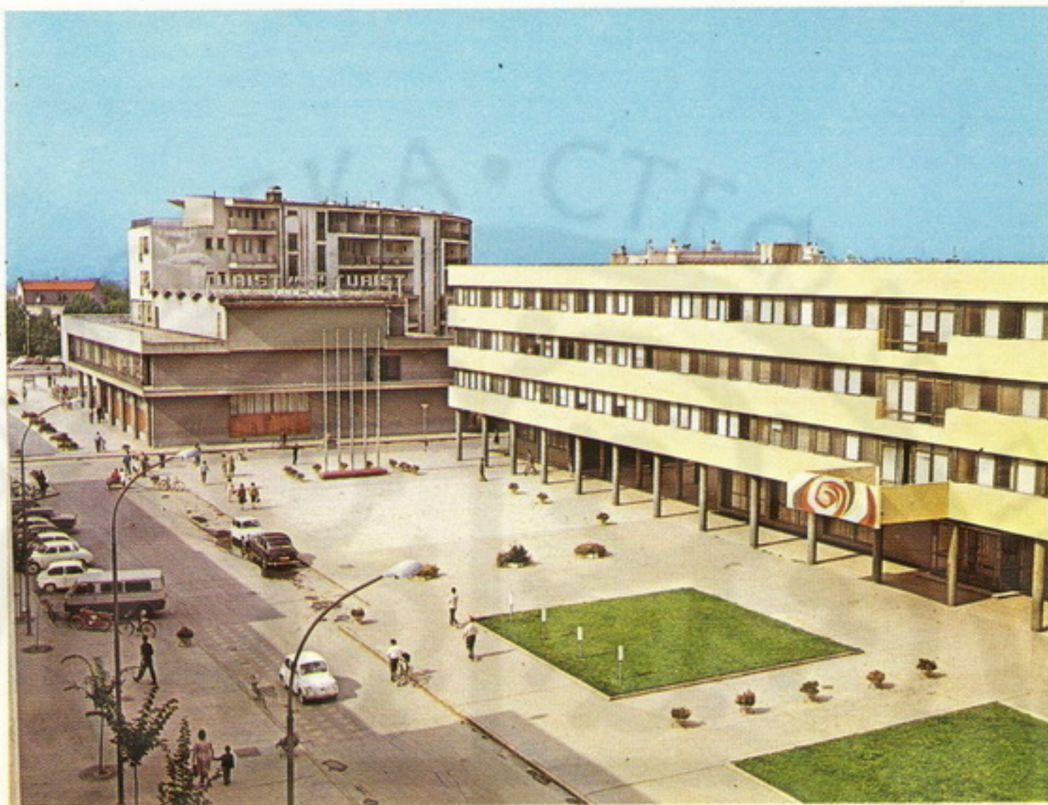
Hotel „Turist“ u Kraljevu