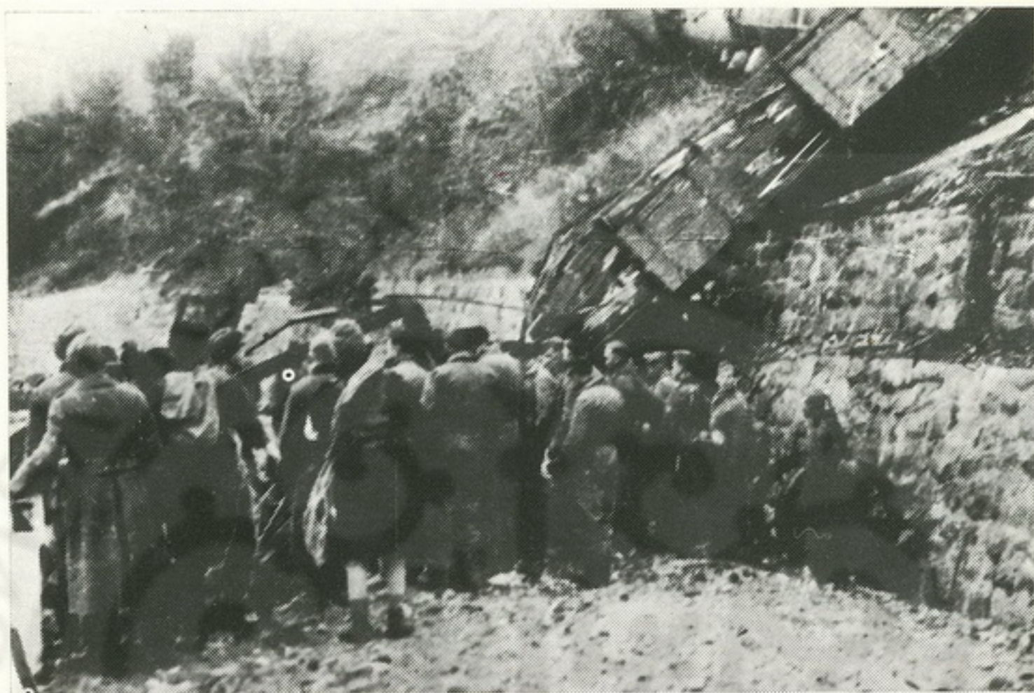
Kraljevački partizani na pruzi Kraljevo—Skoplje pored nemačkog voza koji su uništili

Građani Kraljeva su, takođe, srdačno primili nekoliko stotina izgnanika iz Slovenije i više izbeglica iz drugih krajeva zemlje, deleći sa njima zlehudu sreću ratnih godina.