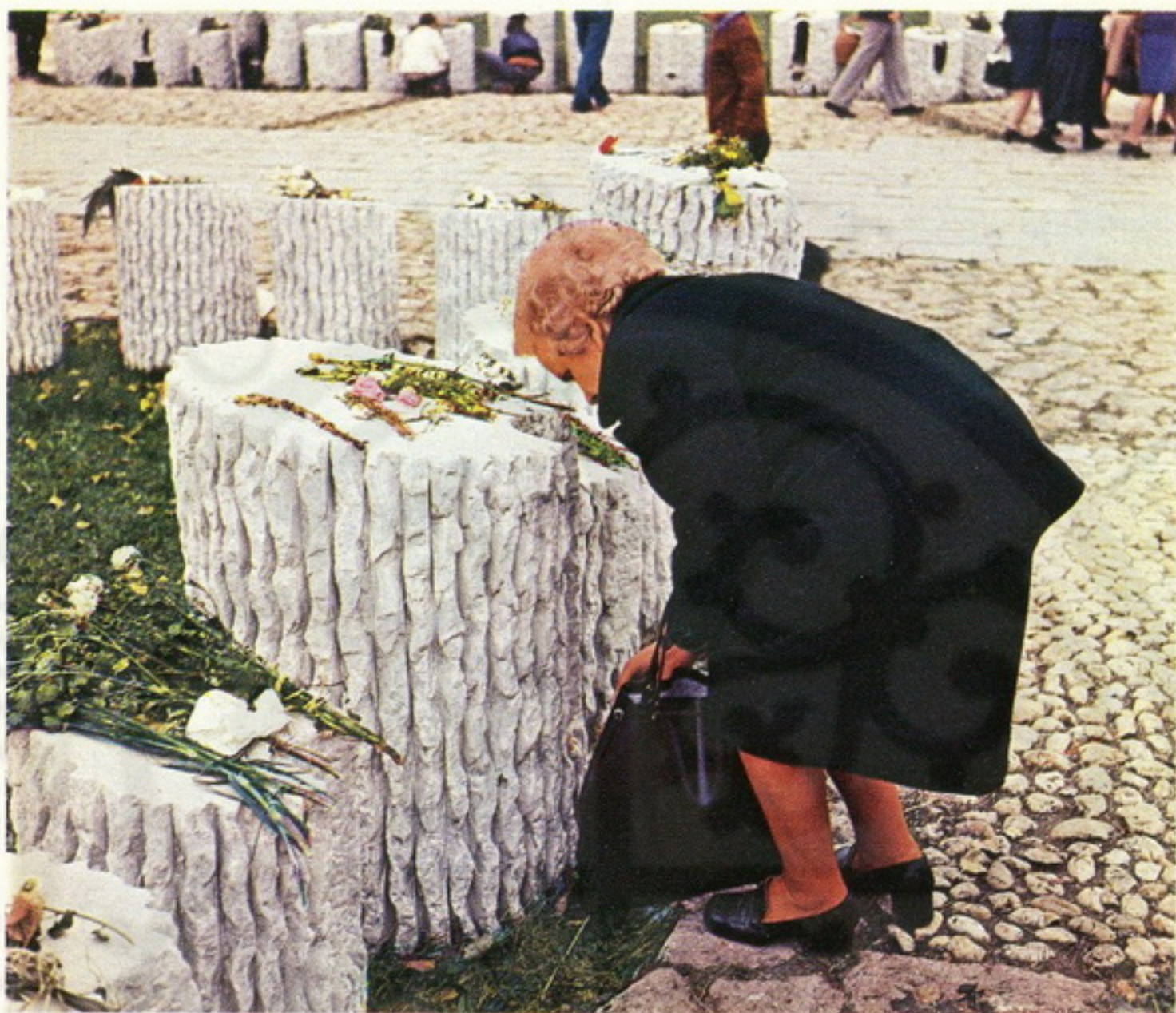
Humke streljanih u Spomen-parku

Svakog 14. oktobra, u 11 časova , na svečanosti se u amfiteatru okuplja više desetina hiljada građana Kraljeva i drugih mesta širom zemlje.